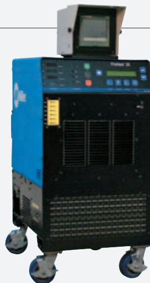
图片显示ProHeat 35带有重载水箱、移动万向轮和数字记录仪

针对感应加热应用进行了优化，冷却器具有9.5升(2.5加仑)防锈聚乙烯罐、高压泵和鼓风机，以产生高冷却能力。